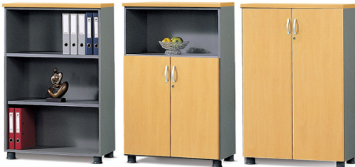
3단 오픈장 W800×D410×H1200 3단 하문장 W800×D410×H1200 3단 울문장 W800×D410×H1200